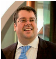
Giorgio D'Alia Sindaco di Portofino